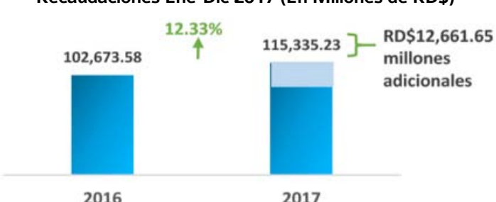
Recaudaciones Ene-Dic 2017 (En Millones de RD$)

Este importante repunte supera el crecimiento nominal de un 7.89% de la economía dominicana, de acuerdo al marco macroeconómico elaborado por el Banco Central y el Ministerio de Economía Planificación y Desarrollo para el 2017.