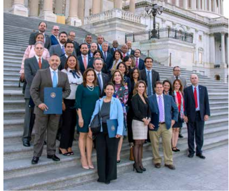
MEETING WITH CONGRESSMAN ADRIANO ESPAILLAT