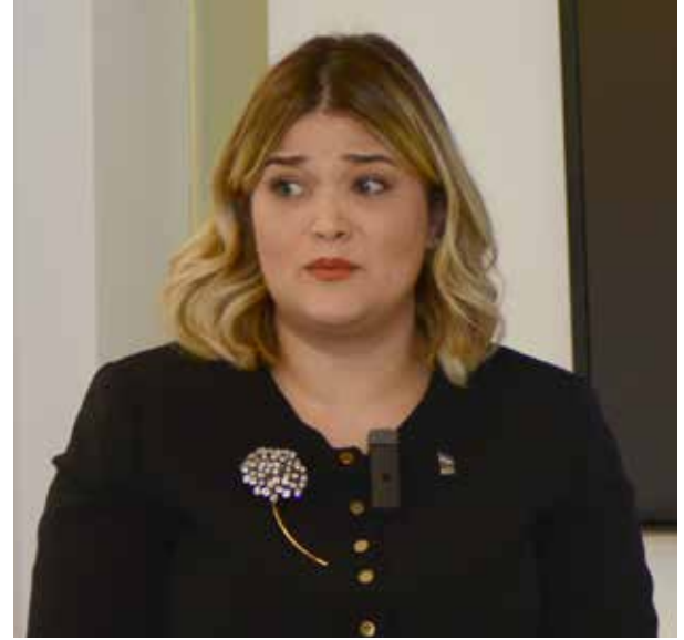
DOMINICANS ON WALL STREET (DOWS)